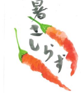
PN:しがらない絵描きさん